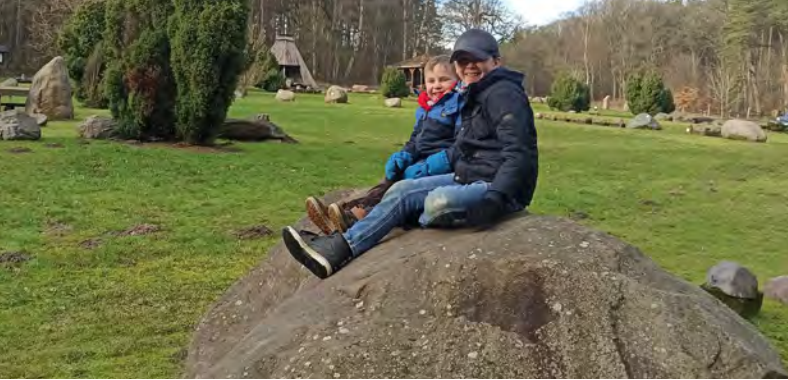
Die Findlinge bei Reddereitz beeindrucken nicht nur die kleinen Besucher