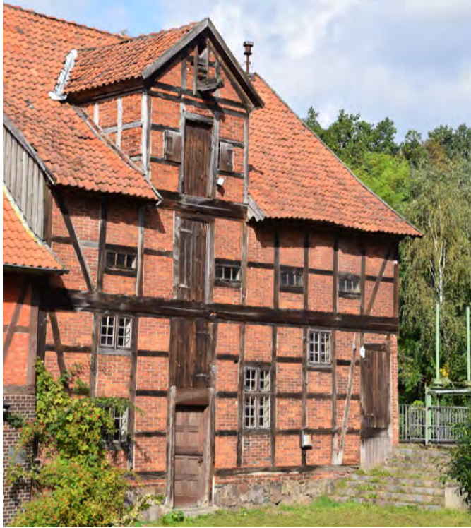
Das imposante Mühlengebäude der Wassermühle Wieren