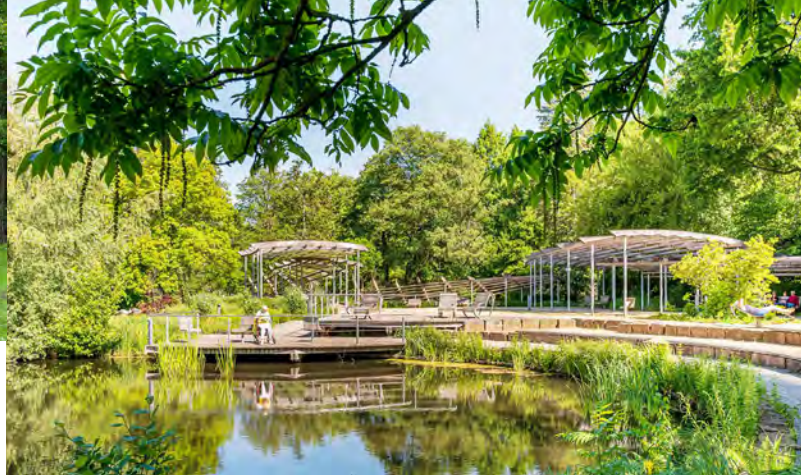
Die Pergola im Kurpark Bad Bevensen lädt zum Verweilen ein