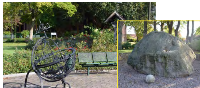
links: Rosengarten Bad Bodenteich, rechts: Der 45 t schwere Riese von Lüder

Ein paar Kilometer der Landesstraße folgen, um dann kurz von Overstedt links nach Bomke abzubiegen. Von dort über eine Nebenstraße nach Schostorf weiterfahren – ein Ort, in dem Karneval eine ganz besondere Rolle spielt. Bad Bodenteich ist nun fast in Sichtweite. Am Brunnen an der Hauptstraße links hineinfahren und vor den Radlern liegt die Burg mit Herrenhaus, Bergfried, Brau- und Backhaus. Ein echter Hingucker ist auch der Rosengarten, der dem Ensemble vorgelagert ist. Wieder zurück auf die Hauptstraße und schon nach wenigen hundert Metern zeigt ein Hinweisschild in Richtung Lüder. 45 erlebnisreiche Kilometer sind geschafft. [Dirk Marwede]