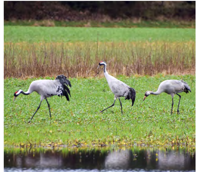
Kraniche fühlen sich im Naturschutzgebiet sichtlich wohl