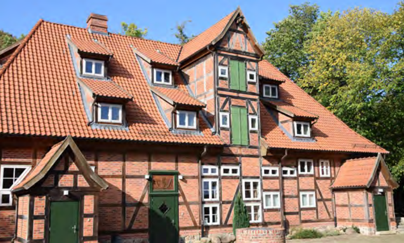
Das Brauhaus liegt gleich neben der Burg Bodenteich – auch ein Herrenhaus und ein Backhaus befinden sich auf der Anhöhe