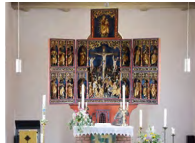
Die Kirche in Eimke verfügt über Schnitzereien aus der Zeit um 1400

Schnitzaltar. Er zeigt unter anderem einen gemalten St. Georg und St. Mauritius sowie eine an Figuren reiche Kreuzigungszone mit vier danebenstehenden Heiligen. Maria im Strahlenkranz und die zwölf aus Holz geschnitzten Apostel machen den Altar zu einem Gesamtkunstwerk. [Dirk Marwede]