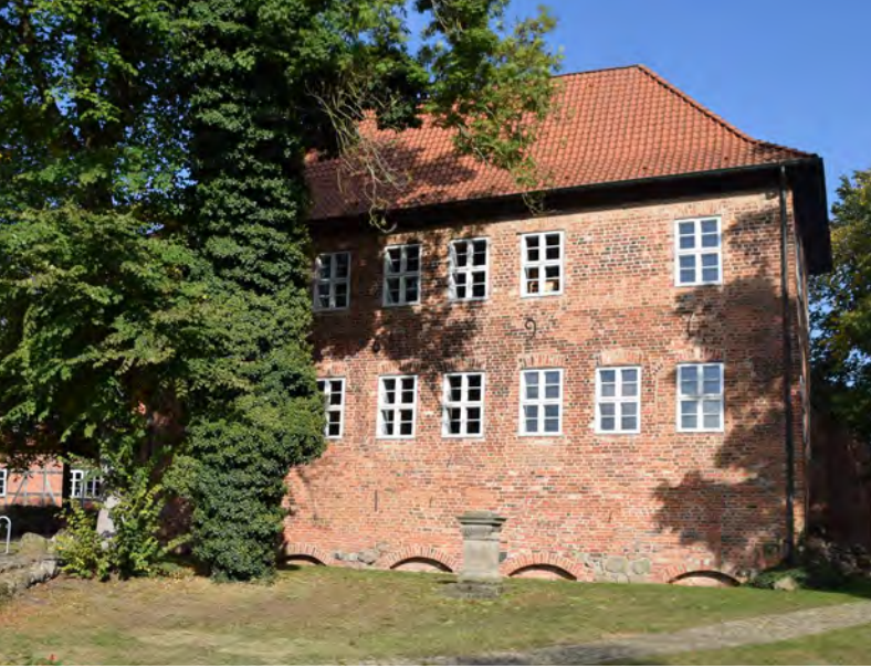
Ausgangspunkt der Tour ist die Burg Bodenteich