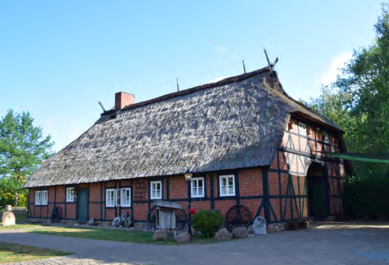
Das 1736 erbaute Rauchhaus stand einst in Hanstedt I