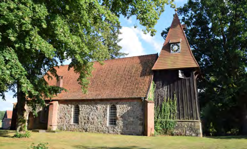
Um 1500 entstand der sehenswerte Schnitzaltar in der St. Georgs Kirche Wichmannsburg