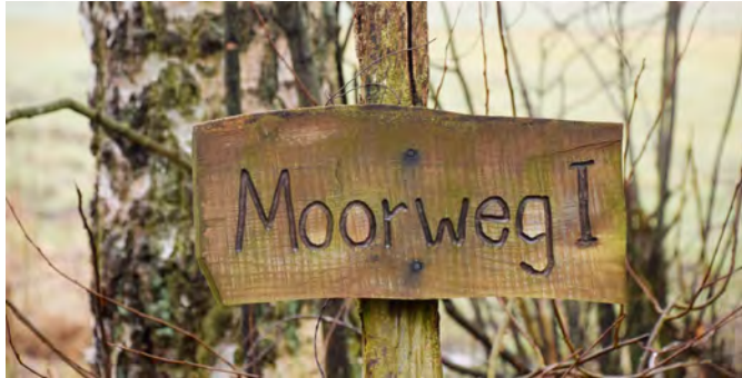
Schilder wie dieses weisen den Weg ins Moor

Vom Aussichtsturm am Waldrand bietet sich zu jeder Jahreszeit ein schöner Blick auf die Moorlandschaft. Und wer ein Fernglas dabei hat, wird sicherlich den einen oder anderen Moorbewohner bei der Futtersuche oder beim Nisten entdecken. [Dirk Marwede]