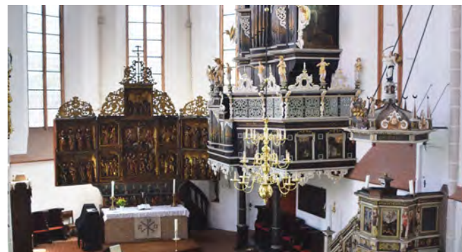
Die Kirche des Klosters Lüne lädt zum Innehalten ein