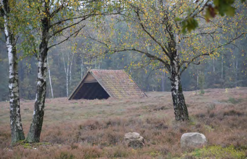
Birken in der blühenden Heide - immer wieder ein schönes Bild