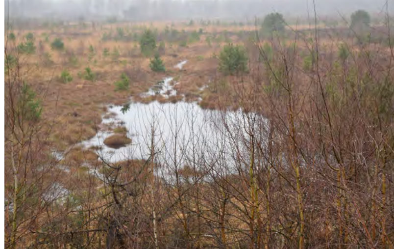
Blick vom Aussichtsturm