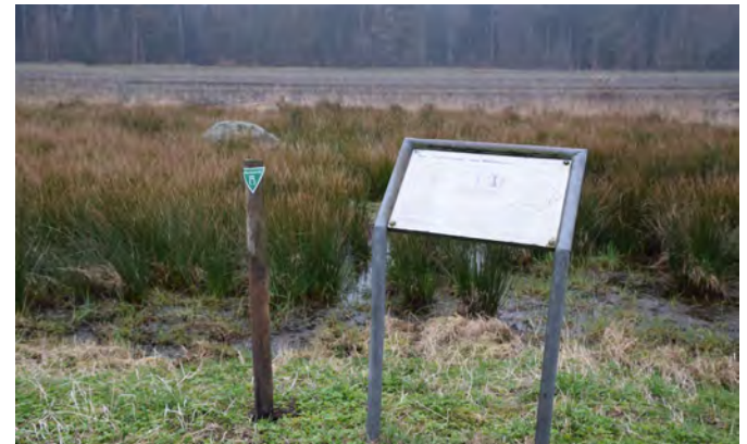
Eine vom Weg her deutlich zu erkennende Tafel erläutert die Erkenntnisse zum Opferstein