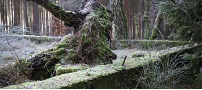
Moosbewachsene Mauern umrahmen die Bodenplatte der einstigen Segelflughalle