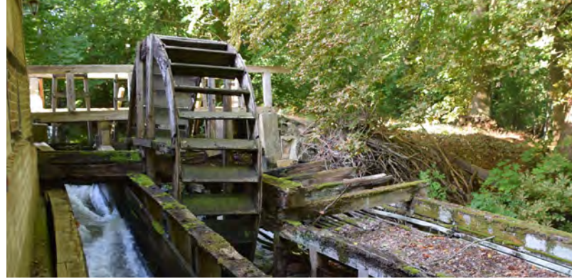
Bis 1950 arbeitete sie, die erstmals 1321 erwähnte Wassermühle in Holxen

Allein die Namen vieler Orte verraten, dass es dort einmal eine Mühle gab: Findorfmühle bei Bienenbüttel, Rockenmühle bei