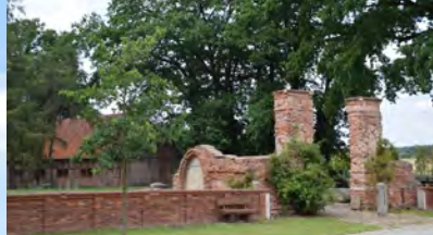
Mauerwerk am Ortseingang Edendorf