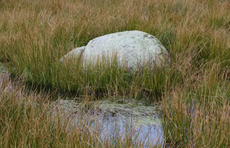
Der Opferstein könnte bestimmt viele Geschichten erzählen