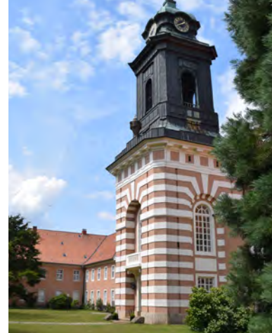
links: Die Königsgräber von Haaßel stammen aus der jungsteinzeitlichen Trichterbecherkultur, rechts: Die Kirche überragt das Kloster Medingen