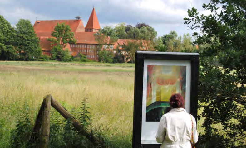
Das Kloster Ebstorf birgt viele Kunstschätze