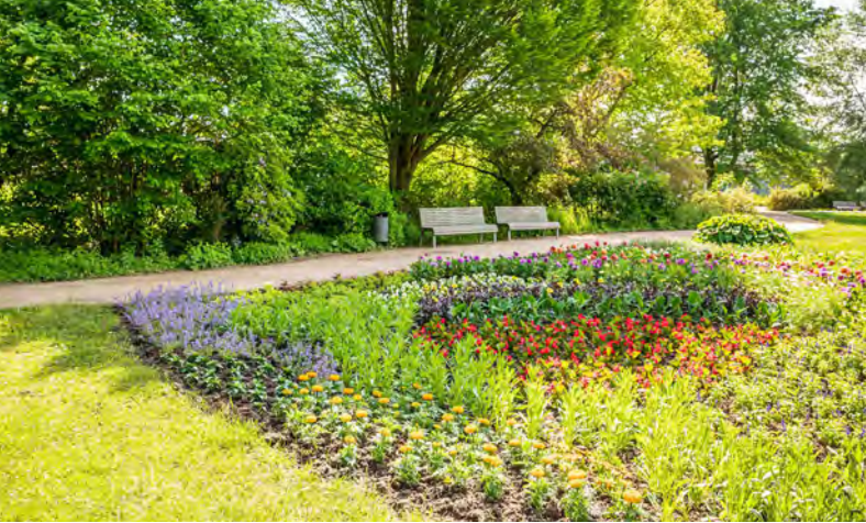
Der Kurpark begeistert durch seine bunte Blütenpracht

sind weitere interessante Pflanzen oder auch Infos, z. B. zum Barfußpfad, zu finden. Die Stationen sind eine bunte Mischung aus allem – Bäume, Pflanzen und Geschichte des Ortes.