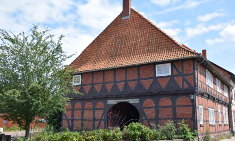
Die ehemalige Vogtei Bienenbüttel, errichtet 1659