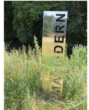
Die Kunstwerke sind aus unterschiedlichsten Materialien gefertigt