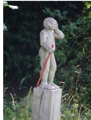
Elf Künstler präsentieren ihre Werke nahe der Ilmenau