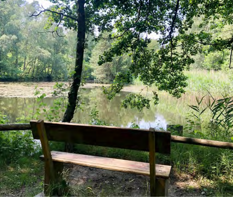
Bänke am Wegesrand laden zum Verweilen ein