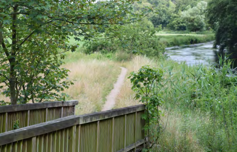
An der Holzbrücke bei Grünhagen biegt der Weg Richtung Osten ab