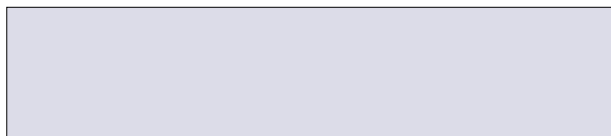
Werbebanner quer im Contentbereich 820 x 200 px

Preise gelten für eine Laufzeit von 14 Tagen.