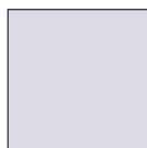
Produktplatzierung im Header