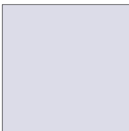
Werbebanner Quadrat in der Sidebar 400 x 400 px